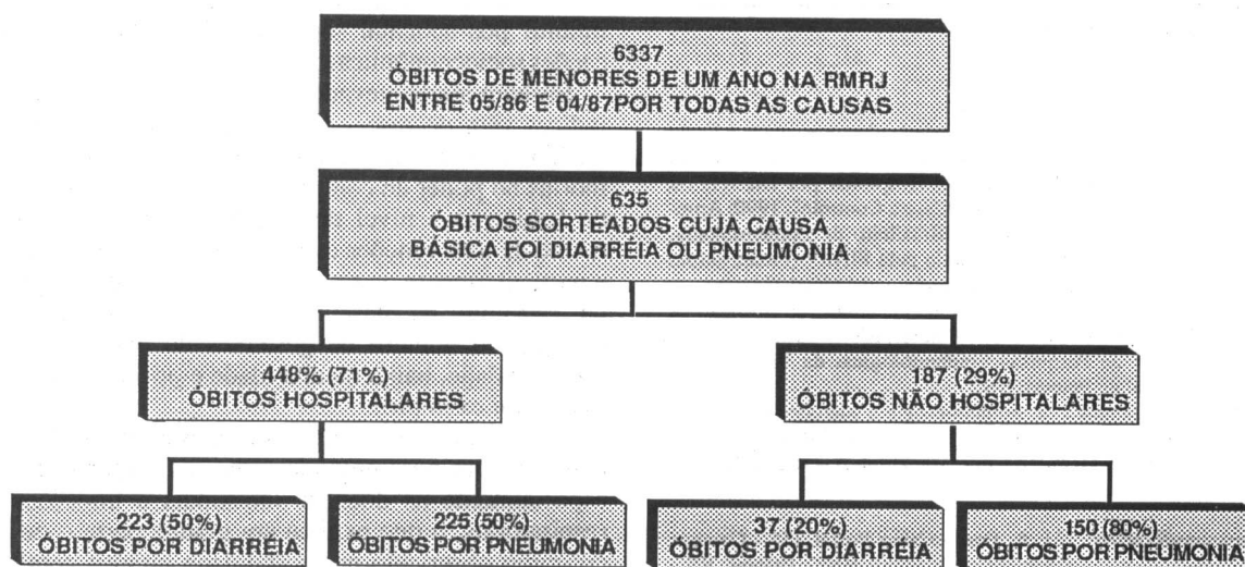
Figura 1. Composição da amostra de casos segundo a causa básica e o local de ocorrência do óbito.

A coleta dos dados foi feita através de dois questionários. O questionário hospitalar foi utiliza-