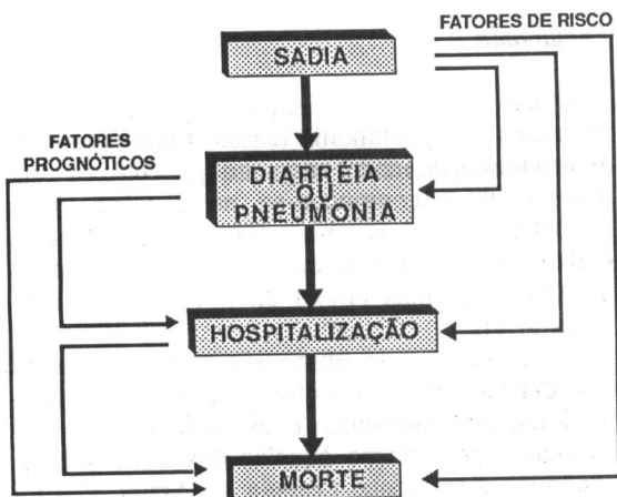
Figura 2. Esquema conceitual de fatores de risco e fatores prognósticos.

Para a análise estatística foi utilizada regressão logística* não condicional. Com esta técnica, foi calculada a razão de produtos cruzados (RPC ou "odds ratios") com intervalos de confiança a 95% (IC); a significância estatística foi avaliada pelo teste de razão de verossimilhança (para variáveis categóricas e para tendência linear). Apesar de na seleção ter sido adotado o emparelhamento, a análise foi realizada com os dados não-emparelhados devido ao volume de perdas o que reduziria substancialmente o número de pares. Como a análise com dados não emparelhados tende a subestimar o risco, este seria, portanto, um viés conser-