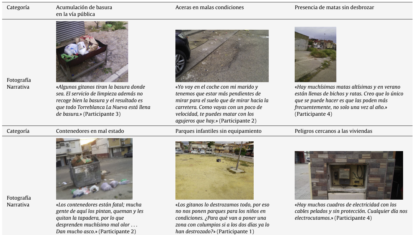
Tabla 2 Fotografías, narrativas y categorías generadas por los/las participantes sobre la insalubridad de Torreblanca La Nueva