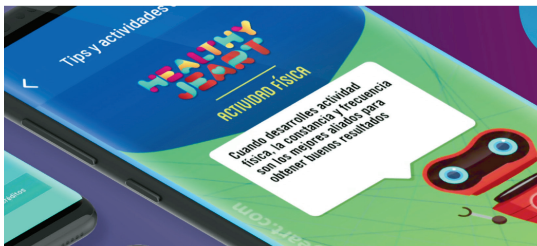
Figura 4 Los tips.

Los retos. Por último, el apartado de retos permite la interacción y competición con otras