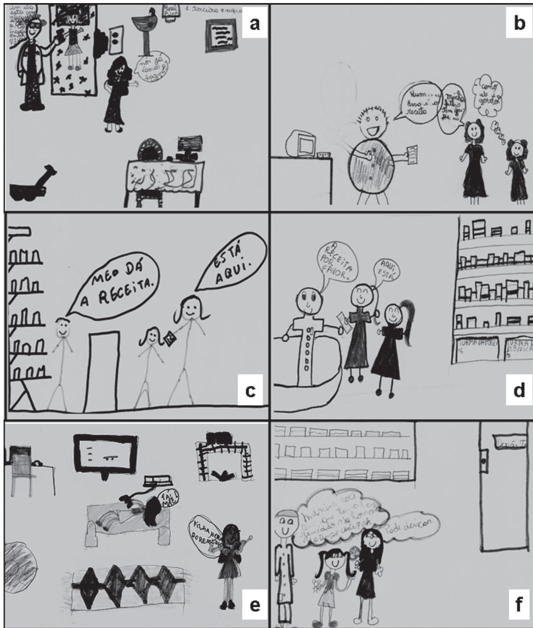
Figura 2. Representação de que todos os objetivos previstos para a estratégia educativa sobre uso racional de antibióticos foram alcançados.

foi planejada sem o conhecimento dos sujeitos da pesquisa (crianças), e que a obtenção dos resultados da pesquisa não esteve vinculada à participação das crianças neste evento.