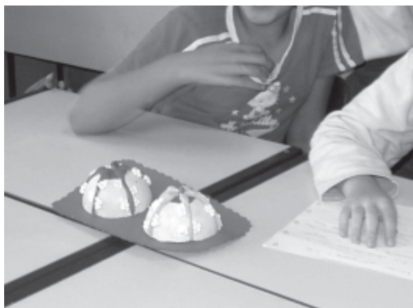
Figura 3. Modelo anatômico de mamas confeccionado pelas crianças com massa de modelar, isopor, tintas e papel cartão.

Duas meninas ensinaram sobre a anatomia e fisiologia da lactação e destacaram a importância da pega correta (Figura 3).