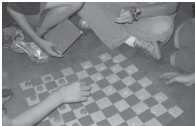
Figura 4. Jogo de dama da amamentação: tabuleiro, peças e caixinha com perguntas.

Um grupo de meninos trabalhou a promoção da amamentação com um jogo de dama: em cada casa do tabuleiro havia uma pergunta e a peça só era movida se a resposta estivesse correta (Figura 4).