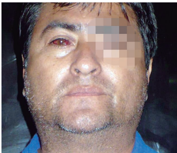
Figura 1. Varón de 45 años con hemorragia ocular derecha

Un varón de 45 años de edad procedente de Iquitos, señaló tener molestias que iniciaron en diciembre del año 2009. El paciente refirió que salió en moto y regresó a su casa a las 21 horas con molestias en el ojo, caracterizado por dolor, ardor, asociado con enrojecimiento conjuntival hacia el borde externo del ojo derecho (Figura 1). Acudió al centro de salud local donde recibió tratamiento paliativo, una semana después persistieron las molestias a las que se agregó discreto defecto motor ocular.