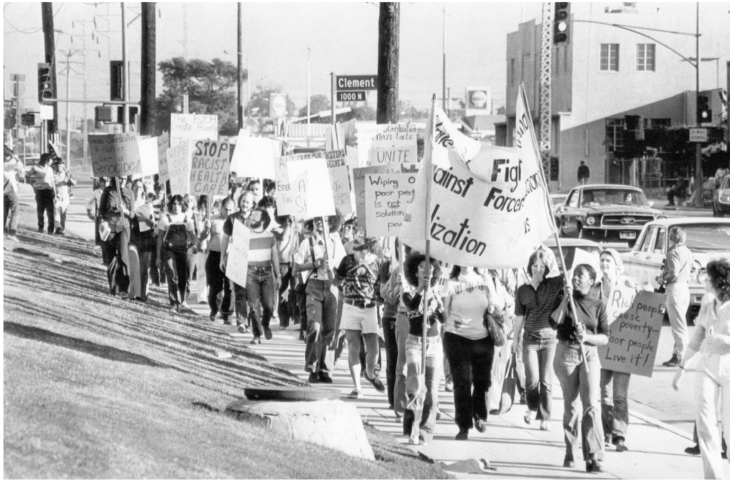
Figura 3. PROTESTA EN LOS ÁNGELES CONTRA LAS ESTERILIZACIONES FORZADAS FRENTE AL HOSPITAL PARA MUJERES DE LA UNIVERSIDAD DE CALIFORNIA DEL SUR - HOSPITAL GENERAL DEL CONDADO DE CALIFORNIA, 1974.