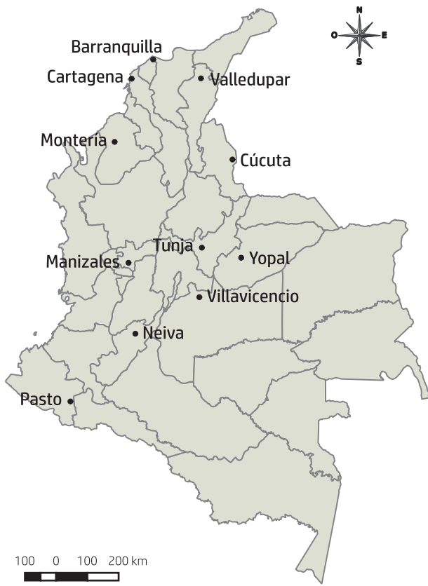
Figura 1. Brigadas realizadas por el Programa Regale Una Vida en Colombia en 2015.