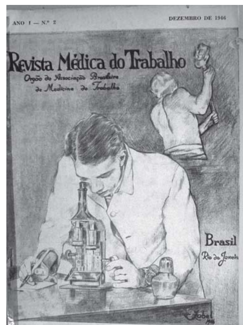
Figura 1. Capa da Revista Médica do Trabalho, ano 1, nº2, dezembro, 1946 (Acervo da Biblioteca do Instituto de Estudos em Saúde Coletiva da Universidade Federal do Rio de Janeiro, IESC/UFRJ).