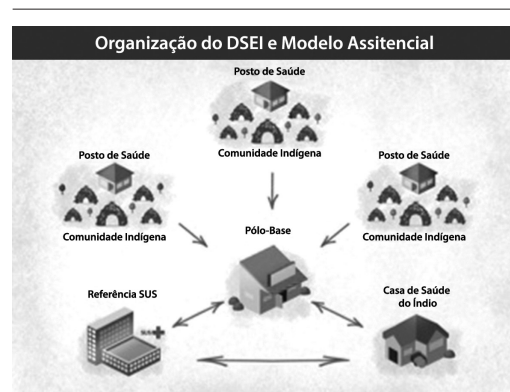
Figura 2. A Organização do modelo de atenção nos DSEI segundo PNASPI, 2012.

Seria ideal que o primeiro apoio aos AIS fosse o atendimento feito pelas equipes multidisciplinares de saúde do polo-base mais próximo; entretanto, a permanência de médicos e enfermeiros em área indígena carecia de continuidade. Como consequência, era frequente a remoção de enfermos para os serviços sediados na cidade. Observou-se que o grau de resolutividade intradistrital disponibilizado pelo DSEIRN era muito baixo e dependente, principalmente, da ação dos AIS.