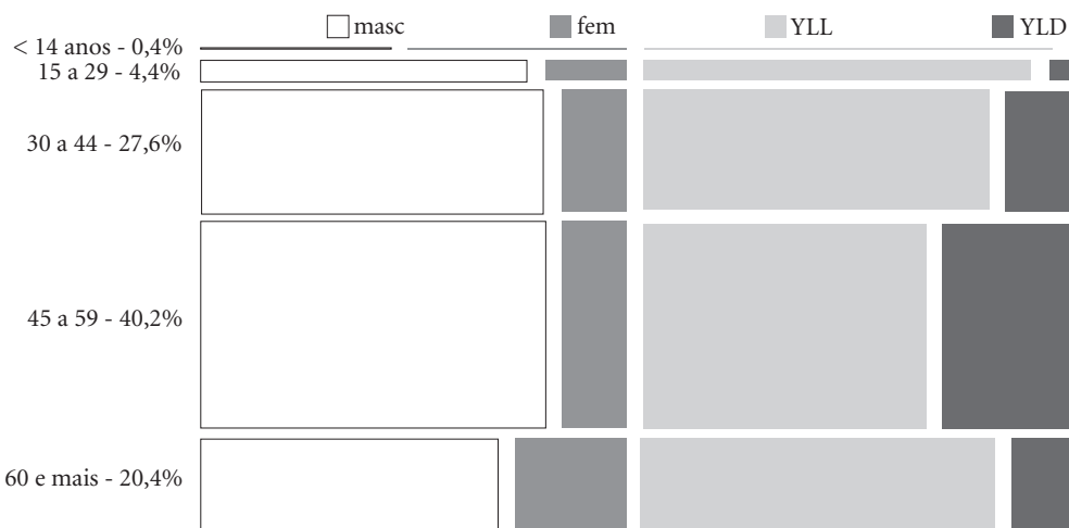
Figura 4. Proporção de YLD, YLL e DALY a para cirrose por álcool e outras causas segundo sexo. Brasil, 2008.

a DALY ( Disability Adjusted Life Years ), o YLL ( Years of Life Lost ) e o YLD ( Years Lived with Disability ).