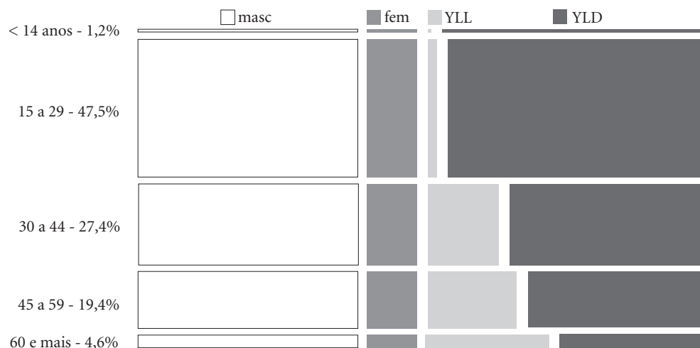
Figura 3. Proporção de YLD, YLL e DALY a para uso nocivo e dependência de álcool segundo sexo. Brasil, 2008.

a DALY ( Disability Adjusted Life Years ), o YLL ( Years of Life Lost ) e o YLD ( Years Lived with Disability ).