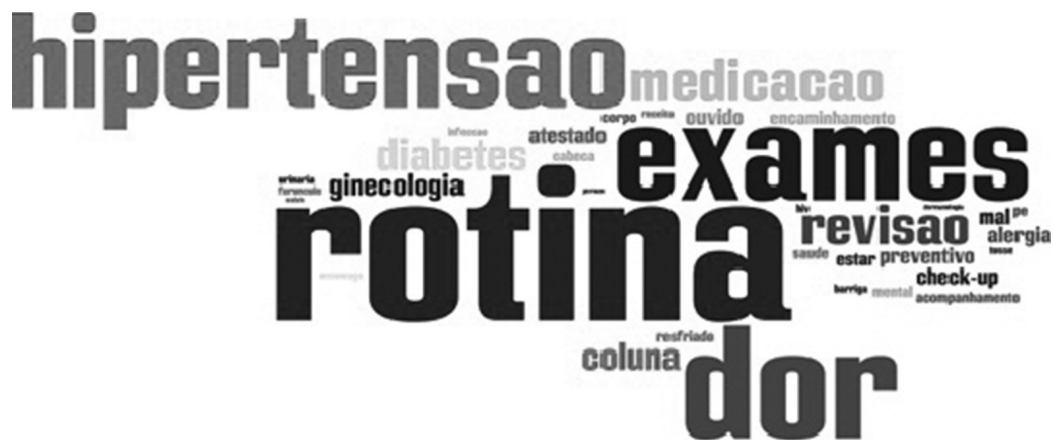
Figura 2. Motivo da última consulta médica entre os usuários adultos.