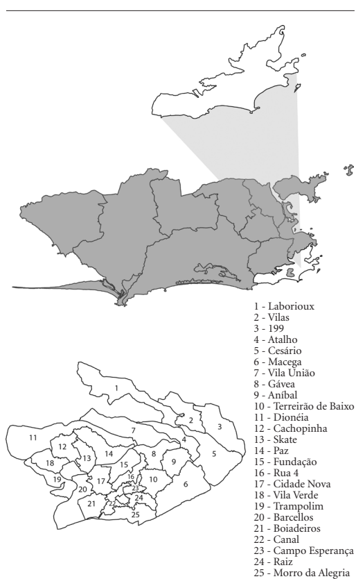
Figura 1. Mapa das Áreas de Planejamento em Saúde da Cidade do Rio de Janeiro (com destaque para AP 2.1) e mapa das 25 Equipes de Saúde da Família da comunidade da Rocinha – 2016.

Ao longo da pesquisa, utilizaram-se os softwares: (i) o programa Teleform 25 na versão 10.5 para o desenho dos questionários, a leitura das