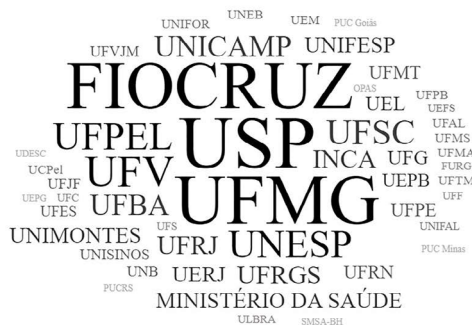
Figura 3. Instituições mais frequentes vinculadas aos autores das publicações da Ciência & Saúde Coletiva sobre DCNT, 2002 a 2019.