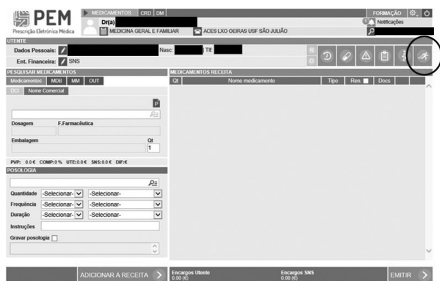
Figura 3. Programa de prescrição eletrônica PEM e ícone destinado ao aconselhamento da atividade física.