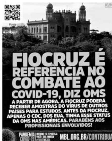
Figura 3. Notificação da falsa campanha de arrecadação recebida pelo Eu Fiscalizo entre 17 de março e 10 de abril.