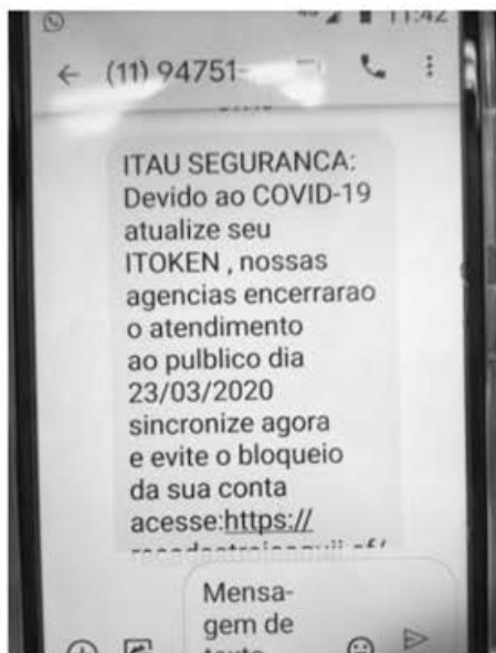
Figura 2. Notificação de golpe bancário recebida pelo Eu Fiscalizo entre 17 de março e 10 de abril.

Este texto apresentou a primeira etapa de uma pesquisa sobre fake news , para compreender a as-