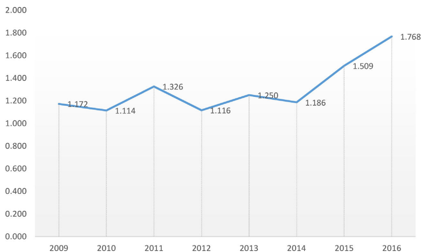
Figura 2. Evolución del factor de impacto.

cer cuartil en los índices del Science Citation Index, concretamente en el lugar 94 de 173, y en el segundo cuartil (lugar 67 de 157) en el Social Sciences Citation Index en la clasificación Public, Environmental & Occupational Health del Journal Citation Reports, siendo la primera revista en lengua distinta del inglés de esta categoría para ese mismo año.