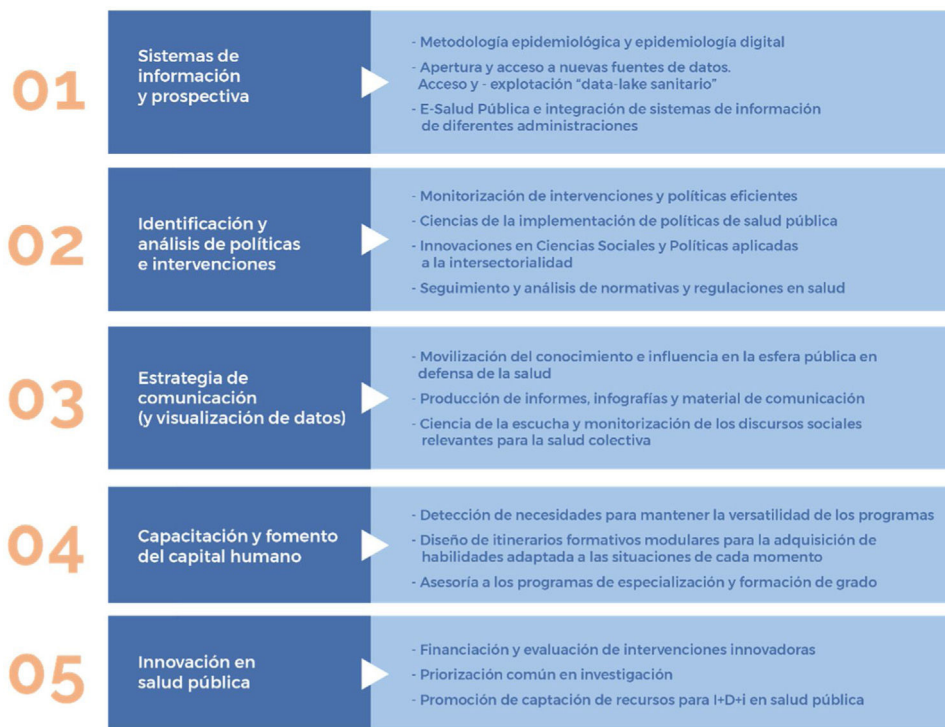
Figura 2. Esquema de las áreas nucleares transversales y los servicios e instrumentos que deben aportar a las áreas temáticas de la futura Agencia Estatal de Salud Pública.

funciones de la salud pública desde hace casi dos décadas en la ciudad.