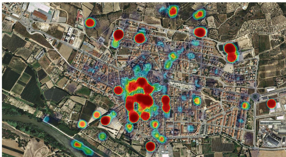
Figura 1. Distribución de activos en salud según el mapa de calor en el núcleo urbano de Torroella de Montgrí (2018).

De la explotación de 2230 activos en salud recogidos en el proceso celebrado en el primer municipio en que se desarrolló la experiencia (Torroella de Montgrí – L'Estartit), se han derivado evidencias destacables, como el vínculo ineludible entre actividad (sociocultural, deportiva, etc.) y activo en salud, el elevado valor del entorno natural y el vínculo de este con la actividad física, las