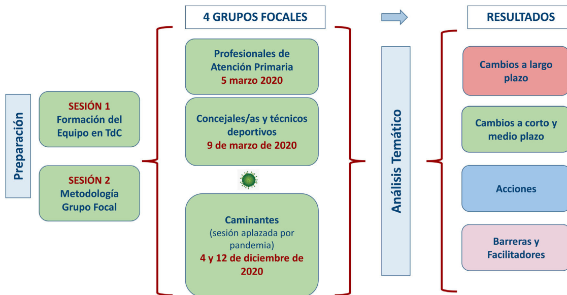
Figura 1. Etapas del proyecto de investigación «Teoría del cambio.Camina: Teoría del Cambio en el programa La Ribera Camina».