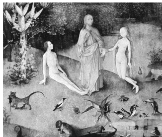
BOSCH, Cristo cria Adão e Eva (detalhe da obra O jardim das delícias), 1500