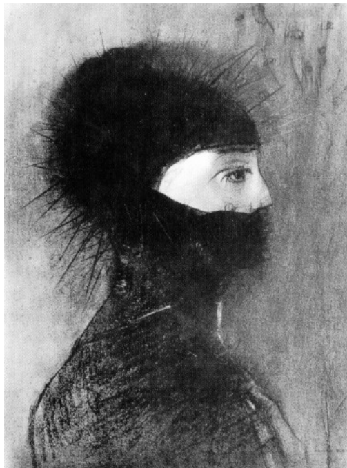
ODILE REDON, A armadura, 1891. The Metropolitan Museum of Art, New York

Segundo Lorenz (1974), a agressividade, cujos efeitos são freqüentemente idênticos aos da pulsão de morte, é um instinto como qualquer outro, e em condições naturais, contribui como todos os outros, para a