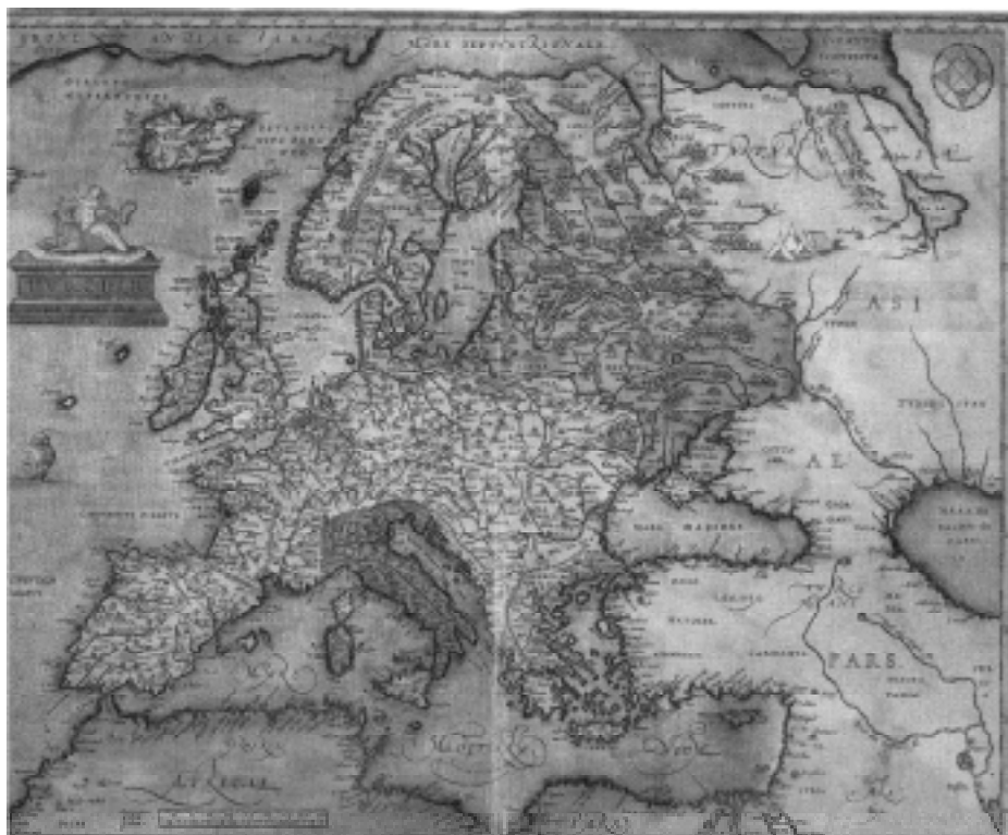
ABRAHAM ORTELIUS (cartógrafo alemão). Europa, 1595