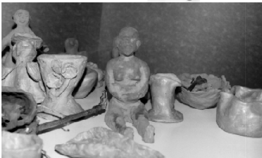
Trabalhos dos grupos Planeta Arte e Reviver, 2000, CSE, Botucatu