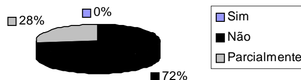
Gráfico 1. Referente à questão: "Você acha que o currículo de pedagogia aborda a questão da saúde na escola?"

A segunda questão pergunta aos respondentes sobre a possibilidade de o currículo de Pedagogia abordar a questão da saúde na escola. As respostas a esta questão estão demonstradas no Gráfico 1: