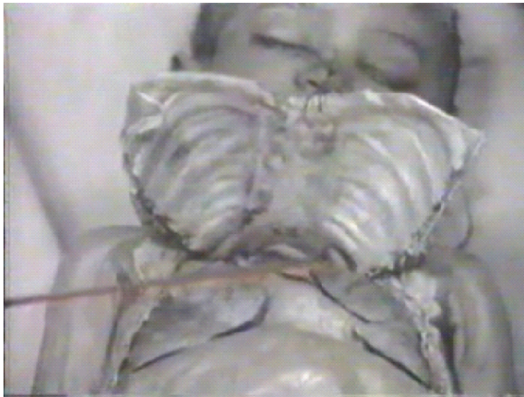
9 Fotograma ou quadro.