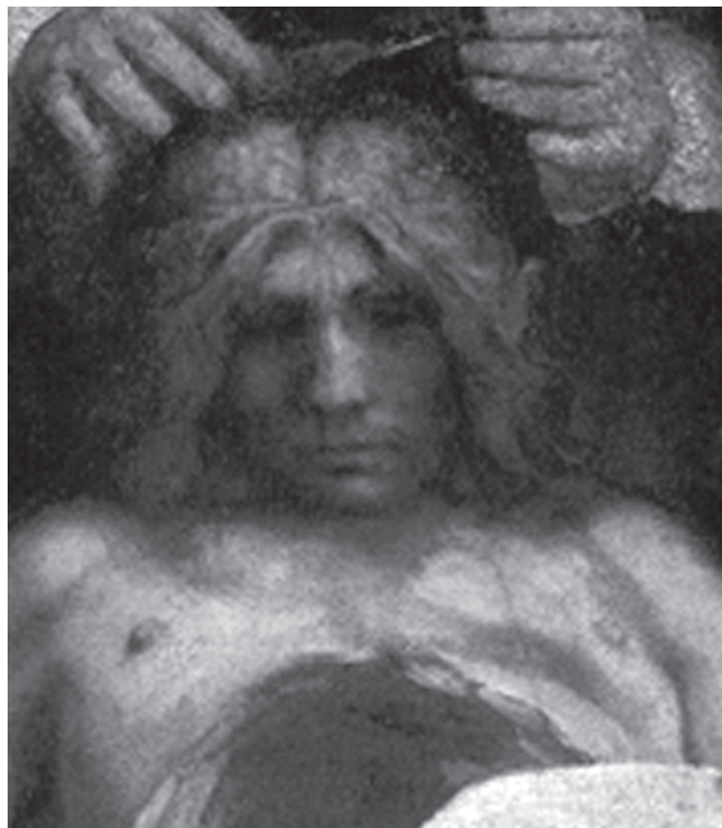
Figura 2. Detalhe da pintura de Rembrandt

A imagem do cadáver da criança nos remeteu, imediatamente, a um detalhe da pintura "Aula de anatomia do Dr. Joan Deyman", de Rembrandt, de 1656.