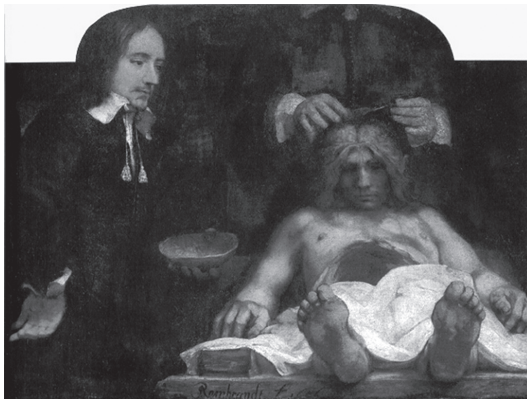
Figura 3. "Aula de anatomia do Dr. Joan Deyman"

O que faz com que uma pintura de 1656 seja evocada e, de certo modo, repetida numa imagem de 1977? O que permite que uma certa prática – a prática do ensino de anatomia – seja representada de modo tão semelhante (embora em materialidades diferentes) apesar dos mais de 300 anos que separam a produção do quadro da produção do vídeo?