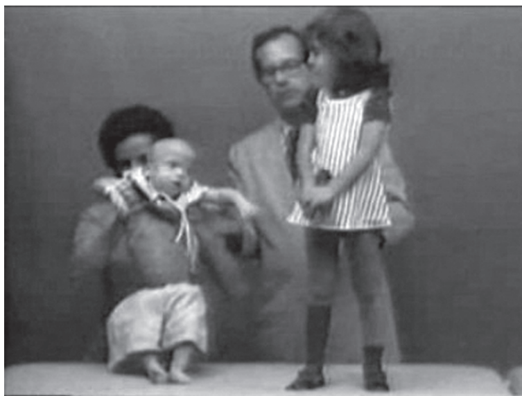
Figura 5. Frame do mesmo vídeo, mostrando diferenças entre crianças com e sem Hipotireoidismo congênito. Texto que acompanha a imagem: "A diferença estatural demonstra a importância dos hormônios tireoidianos para o crescimento adequado"

Essa primeira edição utiliza o mesmo padrão observado no vídeo "Coração: morfologia e relações externas": o texto do filme também é composto por frases curtas e objetivas, utilizando-se recursos visuais – imagens de gráficos e tabelas, "modelos" vivos, imagens radiológicas – e demonstrações de exame, como suporte ou ilustração para o que é dito.