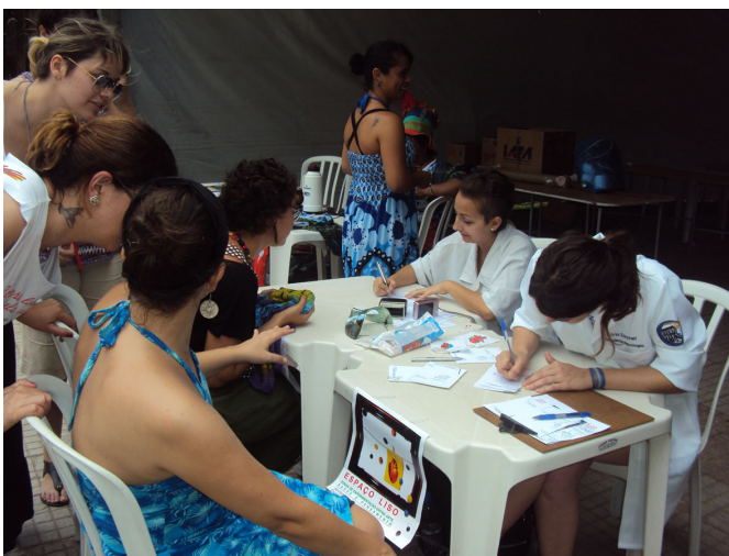
Figura 2. No parque

A última intervenção aconteceu dois meses depois, no pátio de um grande hospital da cidade, que abriga, atualmente, o Chalé da Cultura (antigo ponto de cultura), o qual promove saraus mensais. Era num desses saraus que estávamos. Diferentemente das vezes anteriores, nossa presença não era facilmente percebida. Os jalecos brancos faziam de nós figuras muito semelhantes ao público que por ali circulava – médicos, enfermeiros e técnicos de enfermagem, todos portando seus jalecos, fardamento de trabalho diário (Figuras 2 e 3).