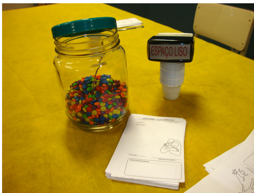
Figura 1. Materiais da intervenção

O nome Receituário Mais que Especial constituiu-se, junto ao Espaço Liso , a partir de uma brincadeira com palavras, numa alusão aos Receituários de Controle Especial utilizados para a dispensa de medicamentos psiquiátricos controlados. A intervenção compreendia a montagem de um estande com insígnias do campo da saúde como: o jaleco, o bloco de receituários, o carimbo, as pílulas, a mesa e a cadeira de consulta, compondo um setting . Porém, estas insígnias estavam ali modificadas, transformadas em algo lúdico: as pílulas eram confeitos de chocolate coloridos; os receituários, confeccionados com imagens remetidas à alegria: um abraço, um sorriso, alguém correndo na chuva; o carimbo trazia a marca “Espaço Liso” em tinta vermelha; uma toalha amarela cobria a mesa, e o espaço previsto para o acontecer da intervenção era a rua, sem as paredes que configuram o trivial de um consultório (Figura 1).