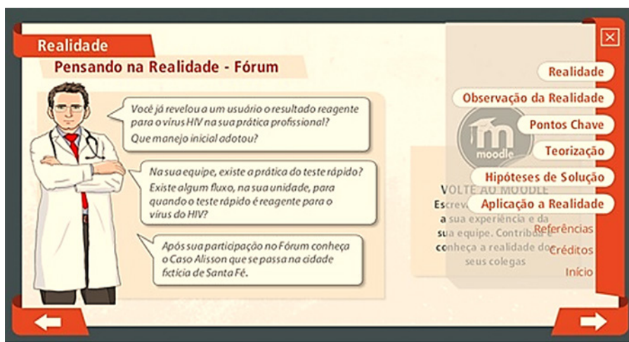
Figura 2. Interface do módulo com as perguntas disparadoras para discussão para o primeiro fórum.

Na premissa da MP, houve a realização de perguntas relevantes sobre as realidades vividas, para compreendê-las e saber manejá-las 13 . As questões norteadoras foram na etapa da Realidade (Figura 2), para serem discutidas no fórum: “Você já revelou a um usuário o resultado reagente para o vírus HIV na sua prática profissional? Que manejo inicial adotou? Na sua equipe, existe a prática do TR? E existe algum fluxo, na sua unidade, para quando o teste rápido é reagente para o vírus do HIV?”. E na etapa de Observação da Realidade, após a apresentação do caso complexo de revelação diagnóstica de infecção do vírus do HIV e uma campanha sem planejamento de TR para infecções sexualmente transmissíveis, as perguntas disparadoras no fórum foram: “Reflita como ocorre o processo de implantação do TR para HIV na realidade da sua unidade de saúde e responda: Existe alguma semelhança da sua prática com o funcionamento do Figueira Nova I (local onde está ambientado o caso clínico)? Como se articulam os profissionais da sua equipe quando o mesmo é reagente?”