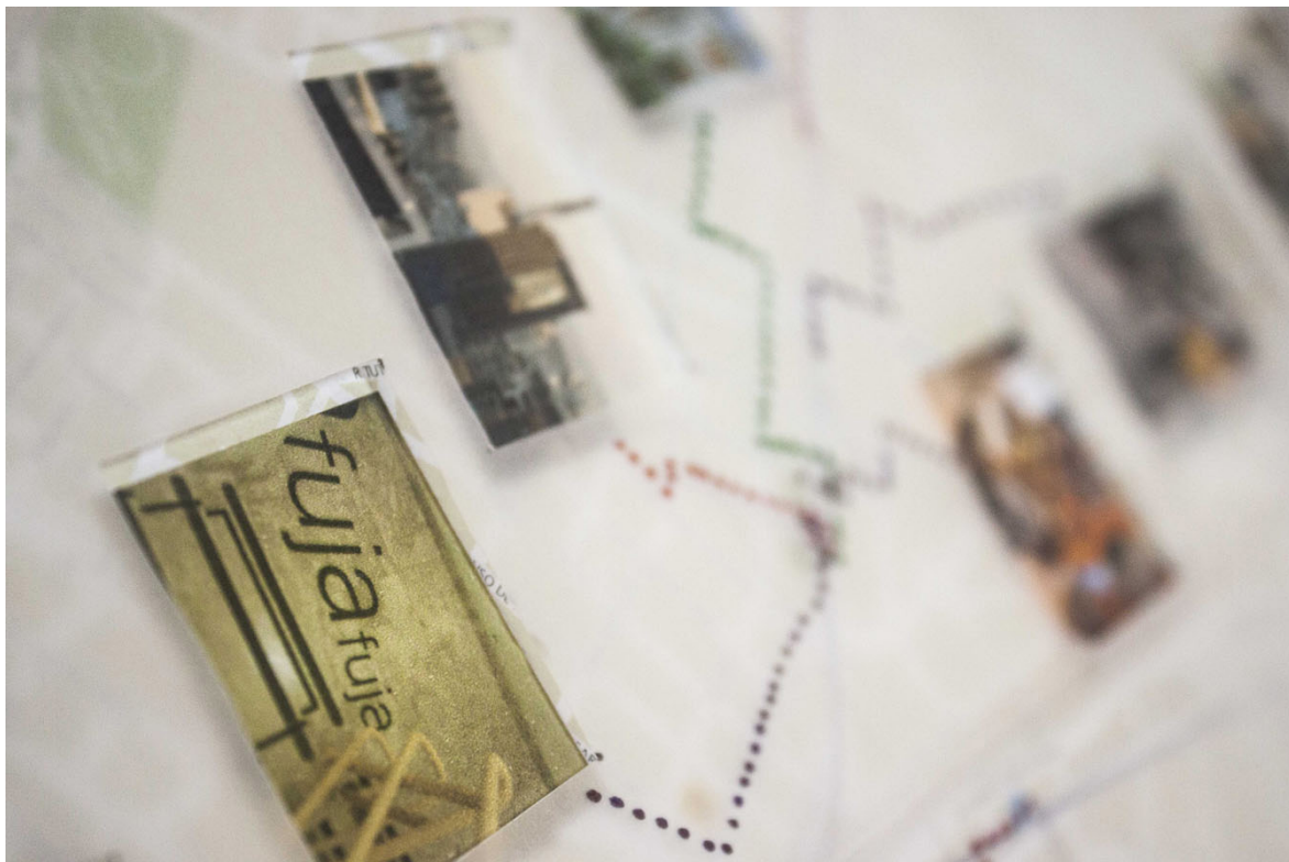
Registros fotográficos do livro objeto Cartografias Encontrarte, de Gisele Asanuma