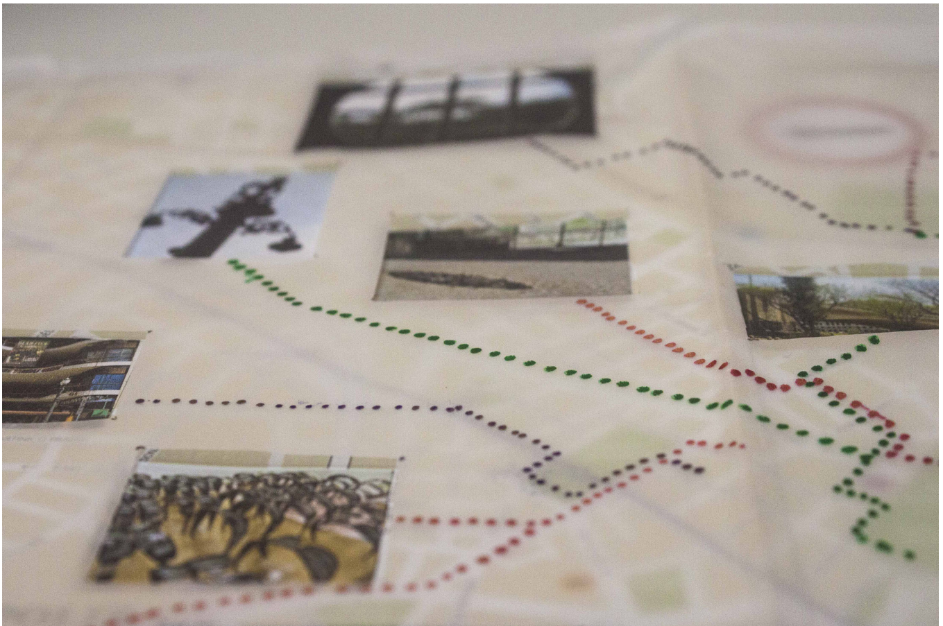
Registro fotográfico do livro objeto Cartogafias Encontrarte , de Gisele Asanuma

Intercalar encontros no consultório-ateliê com saídas pela cidade era o pulso que mantinha o grupo vivo. Nos dez anos de existência, muitas experimentações ocorreram: fotografias, performances , xilogravuras, vídeos, trabalhos corporais, exercícios de escrita, desenhos, intervenções urbanas, colagens, mapas, serigrafias, pinturas, mosaicos, comidas e viagens.