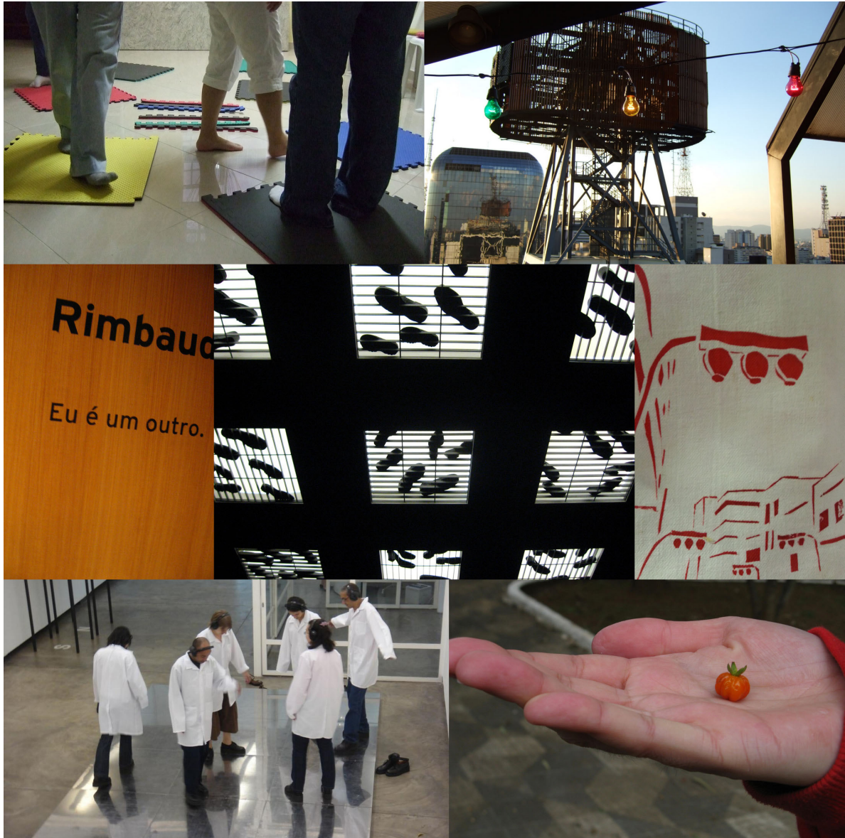
Registro fotográfico de ação coletiva. Acervo Encontrar-te

Outro do grupo, com a mesma atendente de guichê: “Um bilhete pra ida e outro pra volta”. A moça rapidamente estica o braço e entrega o bilhete. Estava ainda transtornada com a abordagem anterior. A fila só aumentava. Desta vez, este usuário do metrô surpreenderia a moça com suas lentidões próprias. Ficou olhando, parado, como se a ação na compra do bilhete fosse apenas da atendente. A mulher então, muito irritada, bate com uma moeda no vidro e diz irritada, para apressá-lo: “São R$ 4,60”. Ele resolve abrir a pochete e procurar o dinheiro. Muito lentamente, ele estica o braço com uma nota de R$ 2,00. “O dinheiro não dá!” Ele pega então, mais uma nota de R$ 2,00. “Agora sim!” – diz ele, com a certeza e a alegria de conseguir concluir a operação com sucesso. O raciocínio parecia ser o seguinte, dois bilhetes, dois dinheiros. A moça do guichê a esta altura estava fuzilando-o com os olhos, a fila aumentava ainda mais. A tensão aumentava. Ele consegue então, dar mais uma nota de R$ 1,00. Recebe o troco e vamos embora, agora não mais fuzilados com o olhar da atendente da bilheteria, mas por toda fila que assistiu à cena que emperrou o fluxo da compra de bilhete de metrô. 4 (p. 11-2)