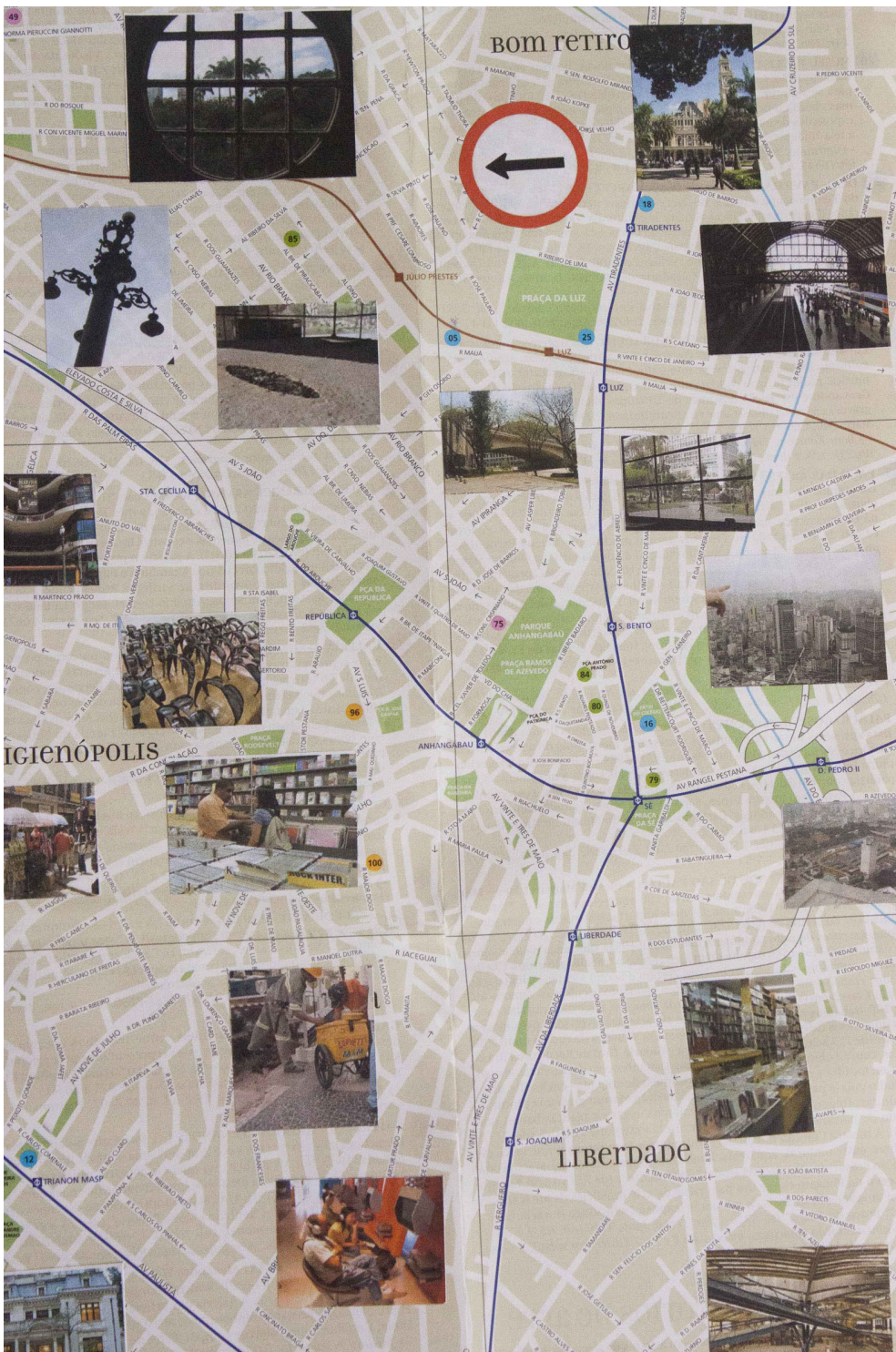
Registro fotográfico do livro objeto Cartografias Encontrarte, de Gisele Asanuma.