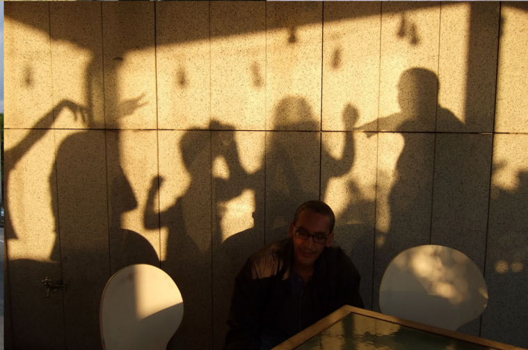
Registro fotográfico de ação coletiva

As alegrias proporcionadas por aquelas tardes eram inúmeras. Naqueles dias víamos a cidade de outros modos, circulávamos por novas ruas, com outras velocidades. Uma estranha alegria, que emocionava. Talvez pela experimentação que podíamos viver juntos. Pela intensa sensação de liberdade e desobrigação. 3 (p. 91)