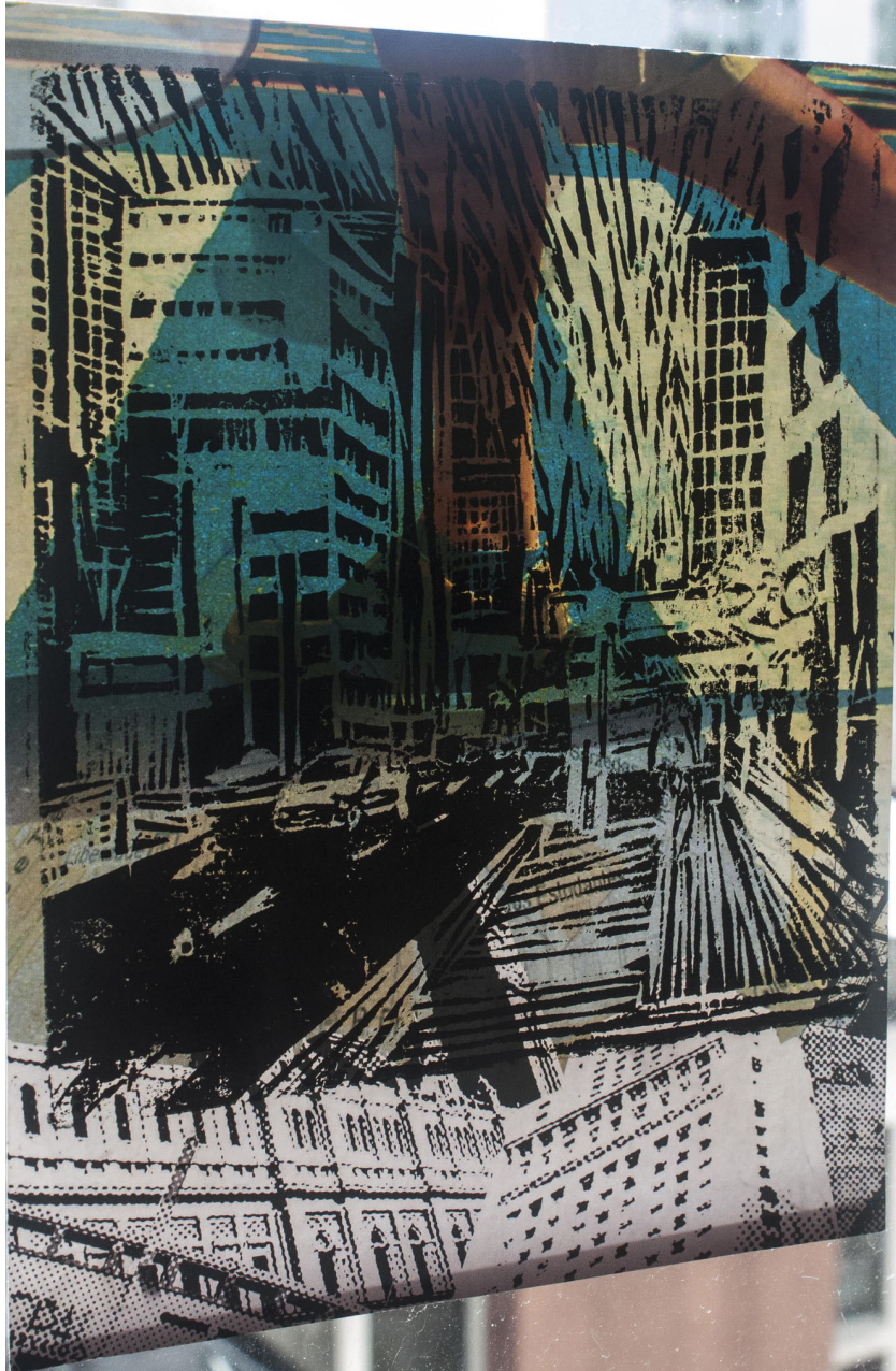
Fotografia de xilogravura de Gisele Asanuma sobre janela