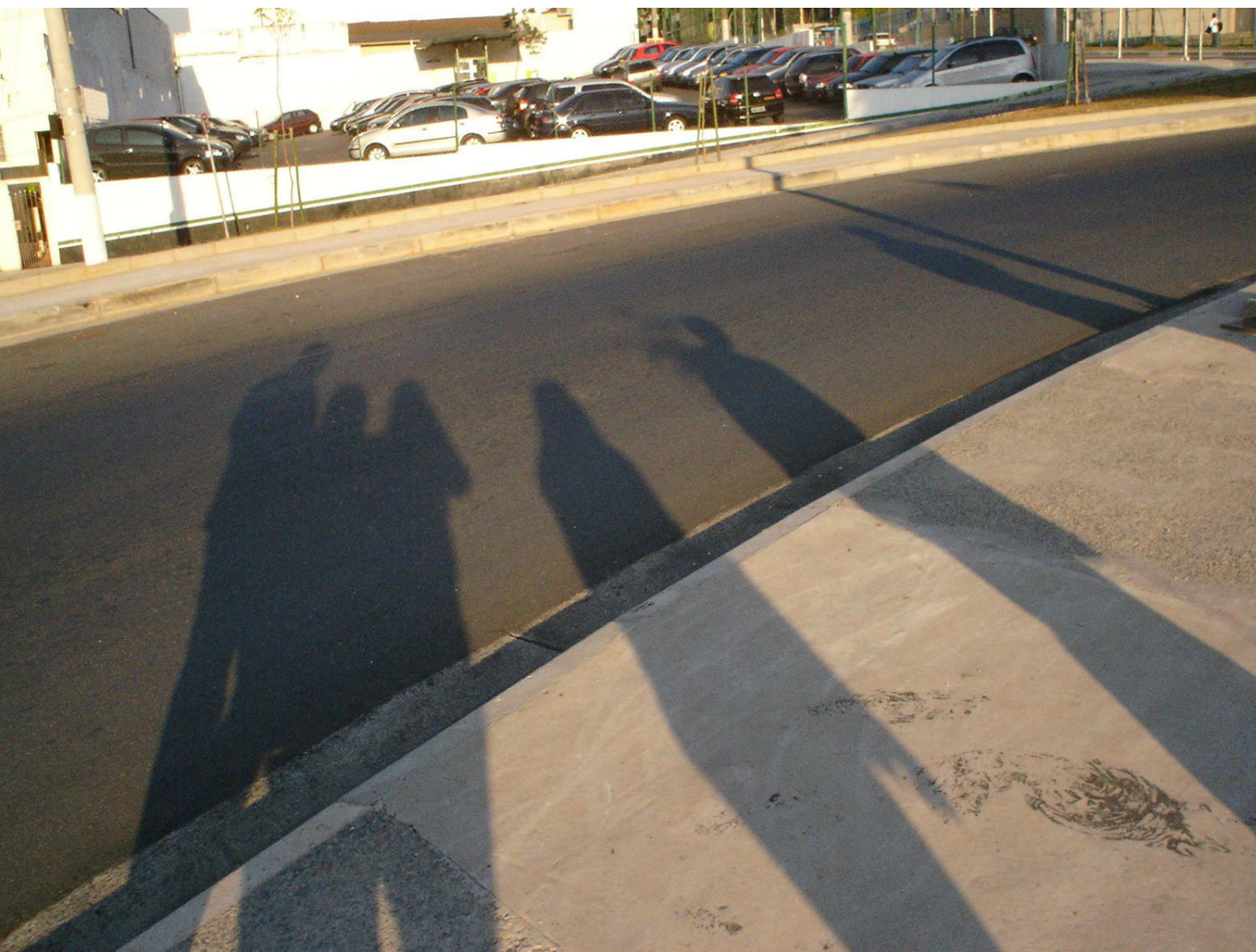
Registro fotográfico de ação coletiva

Em 2005, a partir de inquietações provocadas no encontro de duas estudantes de terapia ocupacional com seus primeiros pacientes, surge o Encontrar-te, um projeto que teve como mote a circulação na cidade de São Paulo, Brasil, por lugares da arte e da cultura e as diversas formas de conviver na cidade. Inquietava que a circulação dessas pessoas parecia se restringir aos seus espaços de tratamento.