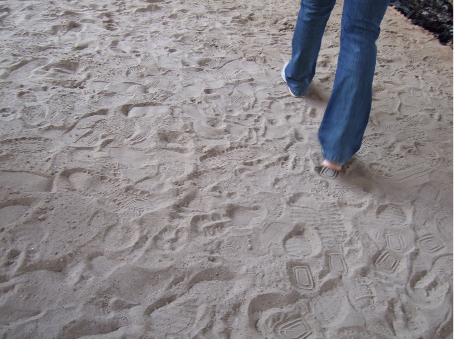
Registro fotográfico de ação coletiva

Mas um meio é feito de qualidades, substâncias, potências e acontecimentos: por exemplo a rua e suas matérias, como os paralelepípedos, seus barulhos, como o grito dos mercadores, seus animais, como os cavalos atrelados, seus dramas [...]. O trajeto se confunde não só com a subjetividade dos que percorrem um meio mas com a subjetividade do próprio meio, uma vez que este se reflete naquele que o percorre. O mapa exprime a identidade entre o percurso e o percorrido. Confunde-se com seu objeto quando o próprio objeto é movimento. 2 (p. 73)