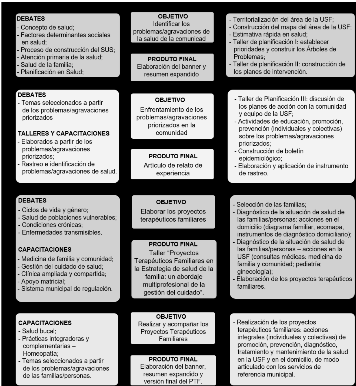
Figura 1. Mapa conceptual de la construcción del conocimiento en las prácticas de integración enseñanza, servicio y comunidad del curso de Medicina de la Universidad Estadual de Feira de Santana, Estado de Bahia, Brasil

en el cuidado de personas/familias en territorios sociales de intercambios de la realidad histórica, social y dialéctica postulado y defendido por Santos (2004) 31 .