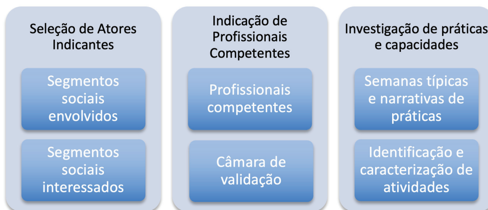
Figura 1. Etapas para definição de perfis de competência, segundo a abordagem dialógica

A análise e a discussão do percurso metodológico utilizado estão apresentadas a partir de etapas e dispositivos empregados, com destaque para a intencionalidade e produtos obtidos (figura 1).