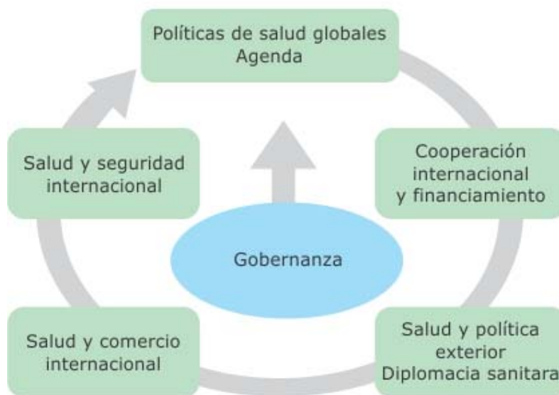
Fig. 1. Salud Global, una nueva estructura política.

Bajo tal perspectiva es posible identificar las dimensiones sustantivas de la Salud Global. Las principales, desde una perspectiva política, son las que tienen que ver con las políticas de salud y su gobernanza, y el financiamiento de la cooperación internacional para la salud. Son importantes también otras tres dimensiones: la relación entre salud y las relaciones internacionales, salud en el comercio exterior, y salud y la seguridad nacional e internacional (Fig. 1).