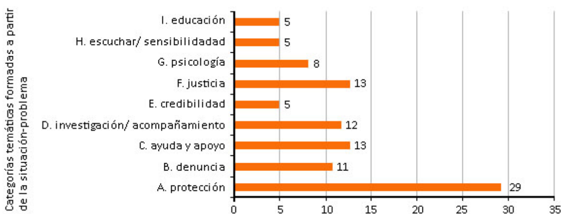
Fig. 2. Distribución de las categorías identificadas por los padres y cuidadores primarios y formadas sobre el papel de las redes de apoyo en el cuidado de los menores abusados sexualmente

Otro aspecto encontrado en los resultados es lo que piensan los padres y cuidadores primarios de como la red de apoyo puede ayudar en el cuidado de los menores abusados sexualmente. En la figura 2 se se recogen nueve categorías temáticas formadas a partir de la situación-problema, en la que predomina la categoría “protección” 29 % (n = 32), seguida de las categorías “justicia”, “ayuda” y “apoyo” con 13 % (n = 14) y en tercer lugar la categoría “denuncia” 11 % (n = 12) (Fig. 2).