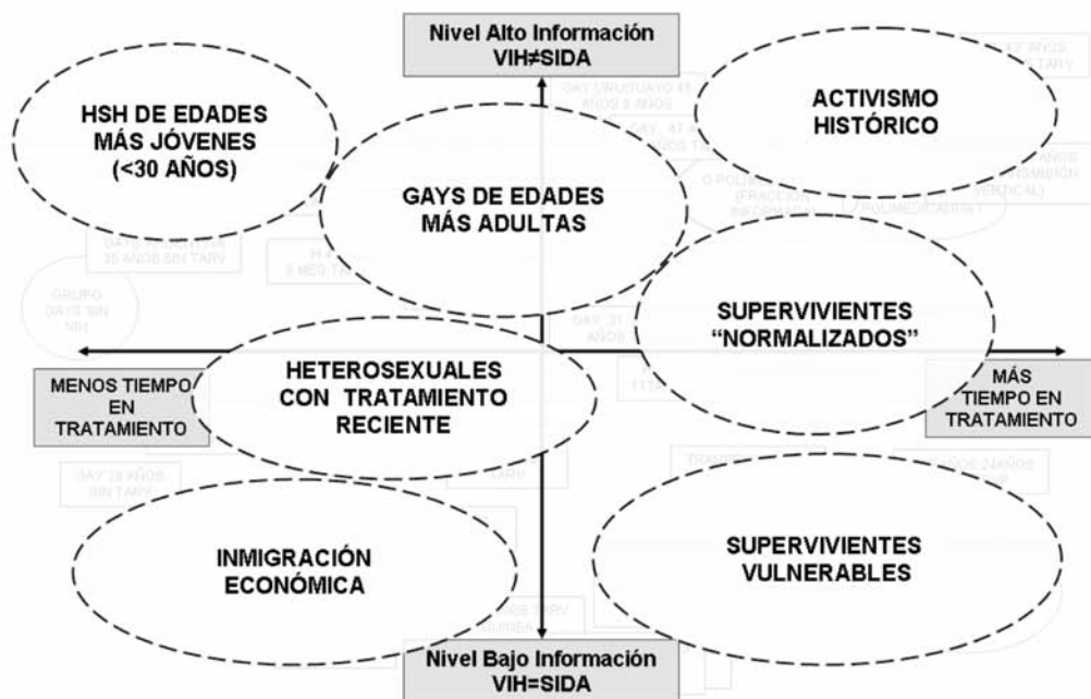
Figura 1 Los siete perfiles de personas con VIH

A partir del relato histórico construido por la mayoría de las personas entrevistadas podemos exponer una narrativa sobre la evolución del VIH que organiza el imaginario en tres “etapas” históricas o fases de la epidemia, particularmente a partir de los tres grandes hitos terapéuticos que significaron la introducción del AZT a finales de los años 80, la aparición de los TARGA en 1996 y la llegada de los actuales tratamientos simplificados alrededor de 2005. Hemos dado a estos periodos, correspondientes aproximadamente a las tres décadas de la epidemia, los nombres de fase “heroica” (1985-1996), fase de “normalización” (1996-2005) y fase de “lo innotado” (a partir de 2005) (figura 2).