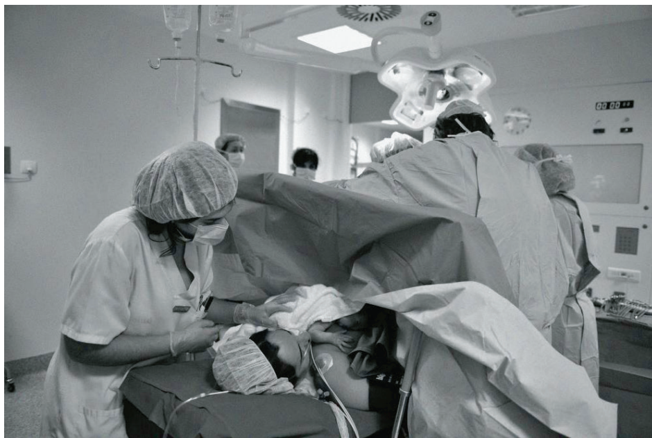
Figura 1 Colocación del niño sobre el pecho de la madre durante la intervención.

a) Cirugía mayor: No se puede perder de vista el hecho de que la cesárea es una intervención de cirugía mayor no exenta de complicaciones y riesgos antes, durante y tras la misma.