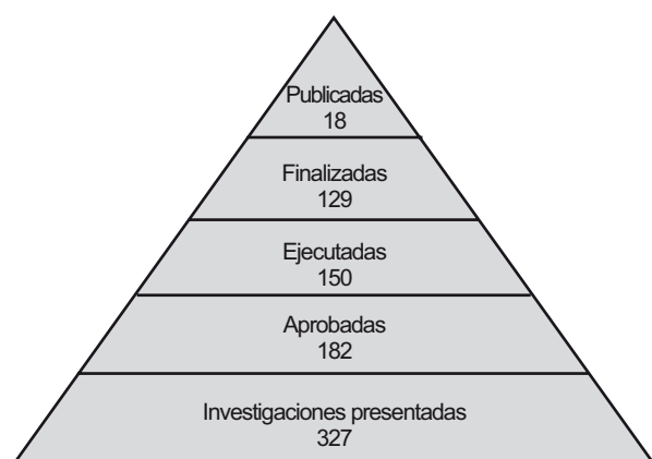
Figura 1. Estado de las investigaciones periodo 2004-2008. Instituto Nacional de Salud

Durante este quinquenio se desarrolló cuatro fondos concursables entre los años 2004 - 2007 (Tabla 1) que