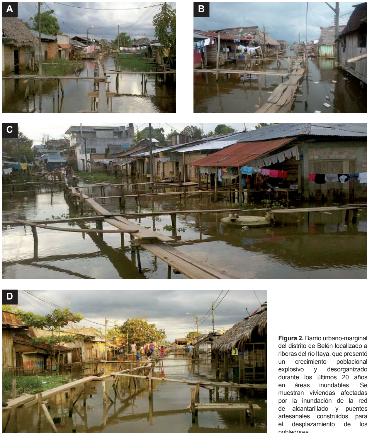
Figura 2. Barrio urbano-marginal del distrito de Belén localizado a riberas del río Itaya, que presentó un crecimiento poblacional explosivo y desorganizado durante los últimos 20 años en áreas inundables. Se muestran viviendas afectadas por la inundación de la red de alcantarillado y puentes artesanales construidos para el desplazamiento de los pobladores.

donde los casos de leptospirosis informados por la Dirección Regional de Salud procedieron de zonas inundadas debido a desbordes de los ríos Itaya, Nanay y el Amazonas; asociados al crecimiento poblacional desmedido y la urbanización desorganizada de los barrios marginales a las riberas de grandes ríos (Figura 2).