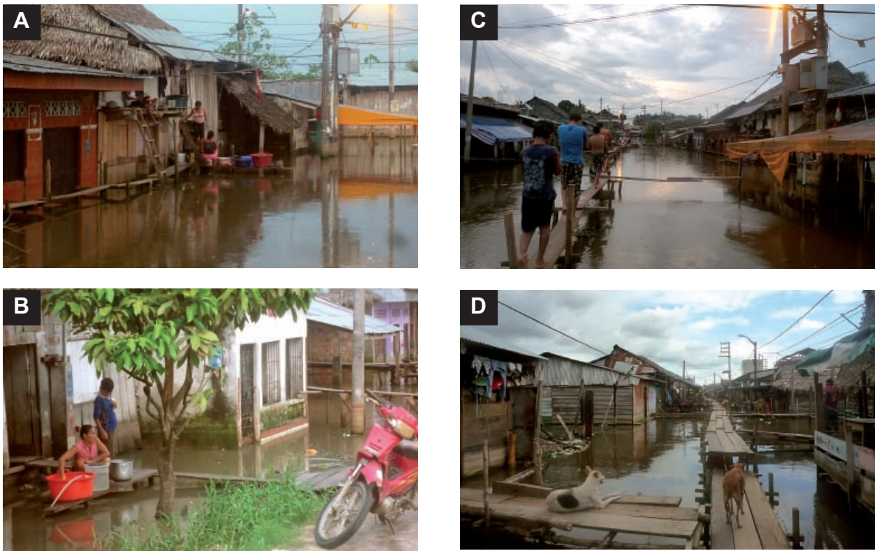
Figura 3. La pobreza y el crecimiento de barrios urbano-marginales de forma desorganizada en áreas potencialmente inundables favorecerían el incremento de leptospirosis en Loreto, Perú.

A) Los pobladores realizan actividades domésticas con el agua estancada de la inundación. B) Ama de casa coleccionando agua procedente del sistema de agua potable sumergido. C) Deambulación sin calzado. D) incremento del contacto con canes.