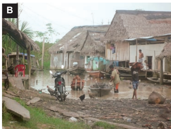
Figura 1. Actividades desarrolladas en áreas rurales y periurbanas de la ciudad de Iquitos.

A) Descarga de madera transportada en botes rústicos ( peque-peque ); B) Casas flotantes a orillas de los ríos.