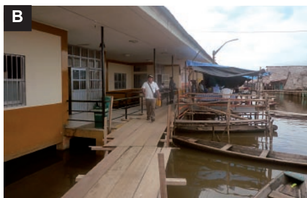
Figura 5. La inundación de localidades periurbanas con crecimiento explosivo y desordenado, condicionan factores de riesgo para la inadecuada atención de los servicios de salud primarios.

A) Centros de salud completa o B) parcialmente inundados, y C) personal de salud en actividades preventivo-promocionales en las localidades inundadas.