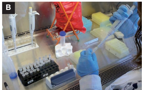
Figura 7. Fortalecimiento del diagnóstico de leptospirosis con técnicas serológicas y moleculares en el CIETROP “Hugo Pesce - Maxime Kuczynski” de la ciudad de Iquitos.

A) Equipo de PCR en tiempo real para Leptospira sp . B) Procesamiento de muestras de suero para ELISA IgM de Leptospira sp