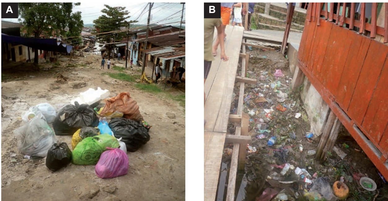
Figura 4. La inundaciones favorecen la inadecuada disposición de residuos sólidos y el colapso de las redes de alcantarillado, que contribuyen a la aparición de roedores.

A) Los pobladores realizan actividades domésticas con el agua estancada de la inundación. B) Ama de casa coleccionando agua procedente del sistema de agua potable sumergido. C) Deambulación sin calzado. D) incremento del contacto con canes.