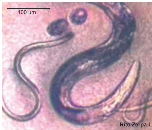
Figura 5. Strongyloides fuelleborni : adulto, huevos y larvas filariformes del parásito (de cultivo) (Video 5)

El diagnóstico de laboratorio, se confirma al examen microscópico directo por la presencia de huevos en cadena con envoltura amorfa, características de