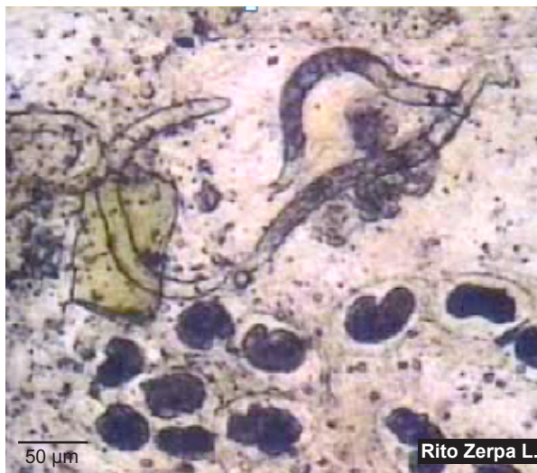
Figura 1. Larvas rabditoides y huevos en cadena, preparación en montaje húmedo a partir de muestras de heces frescas de paciente con Strongyloidosis ( Video 1 )

que era más prevalente que la infección por S. stercoralis ; Pampiglione y Ricciardi reportaron casos de infección por S. fuelleborni en Papúa – Nueva Guinea con prevalencias de hasta 4,5%. S. fuelleborni tiene como reservorio a los primates en África; y de las poblaciones rurales tropicales y subtropicales se han transmitido en áreas urbanas y suburbanas, incluso en ausencia del hospedero definitivo (primates). También se ha planteado una transmisión interhumana a través de la lactancia materna y de una perpetuación de la infección humano – humano. Tiene el mismo ciclo de vida que S. stercoralis , con capacidad de reproducción dentro del ser humano (autoinfección), una causa de cronicidad.