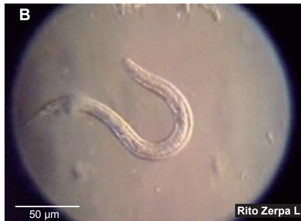
Figura 3. A. Strongyloides fuelleborni larva rabditoide en imagen bidimensional (Video 3A) y B. tridimensional (Video 3B).

La patogenicidad de S. fuelleborni , poco estudiada, muchos autores coinciden que produciría infecciones leves y bien toleradas en el huésped inmunocompetente, siendo la infección diseminada rara; en inmunodeprimidos: personas tratadas con corticosteroides, leucemia de las células T, tumores malignos, HIV, infección HTLV-I, desnutridos graves, en estos casos se desarrolla estadíos severos de la enfermedad. Strongiloidosis diseminada aún es controversial. Las manifestaciones clínicas son similares a las producidas por S. stercoralis , siendo las más frecuentes gastrointestinales: diarreas recurrentes, náuseas y vómitos, respiratorias, dermatológicas: larva currens (2) .