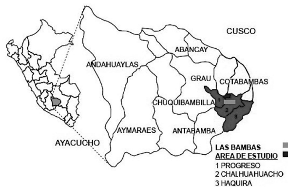
Figura 1. Mapa de la provincia de Apurímac donde se desarrolla el proyecto minero Las Bambas

Se realizó un estudio descriptivo de corte longitudinal en la población de tres distritos de la región Apurímac: Chalhuhhuacho, Progreso y Haquira, que residen en el área de influencia social del proyecto Las Bambas, para determinar los niveles de plomo, cadmio, arsénico