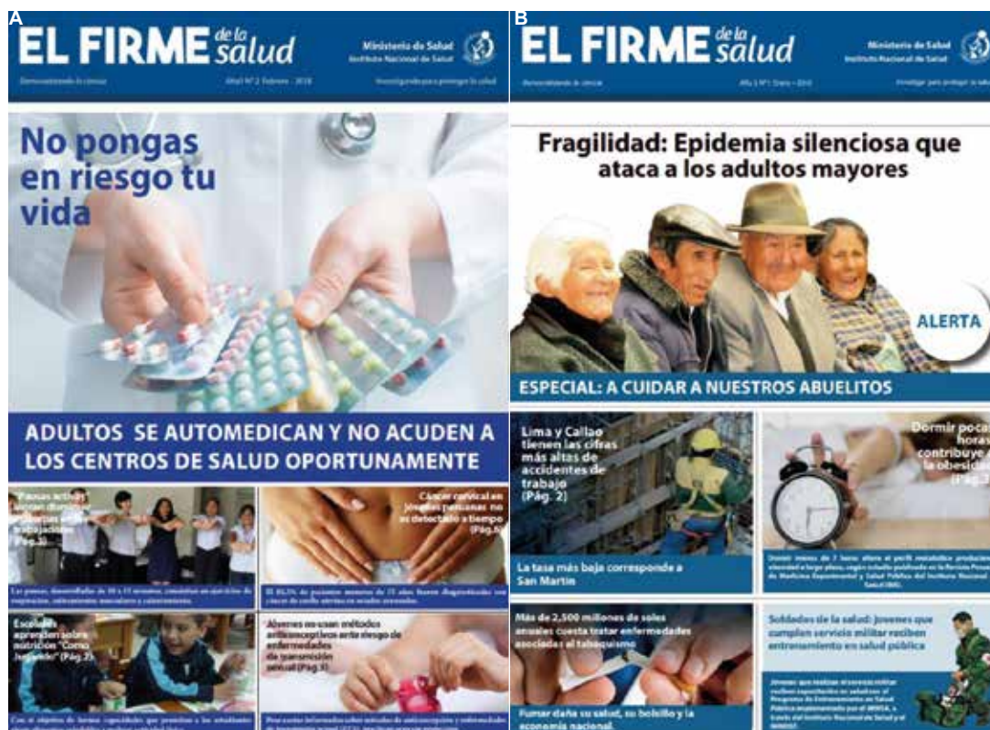
Figura 3. Portadas del periódico mensual «El Firme de la salud» A) Número 2 mes de febrero 2018, B) Número 1 mes de enero 2018.

Es una publicación mensual que tiene como lema «Democratizando la ciencia», su objetivo es presentar aquellas publicaciones científicas de la Revista Peruana de Medicina Experimental y Salud Pública (RPMESSP) seleccionadas por: a) importancia en la salud pública nacional, b) posibilidad de impacto como noticia, c) actualidad de tema tratado y d) contener información de aplicación en la población peruana. También incluye publicaciones científicas seleccionadas de revistas científicas internacionales que cumplan con los criterios anteriores. El periódico es distribuido en formato impreso, y en formato digital a través del portal web del INS. (Figura 3).