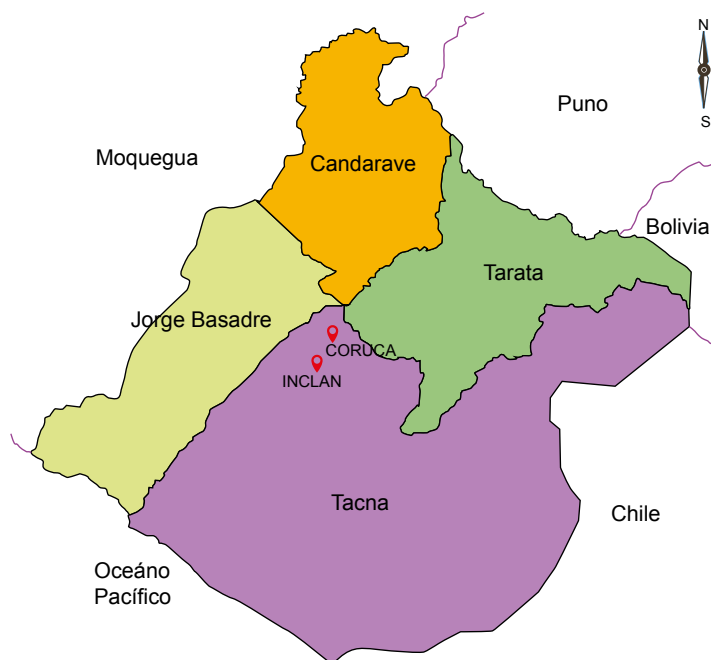
Figura 1. Mapa físico del departamento de Tacna y ubicación de la localidad de Coruca en distrito de Inclán.