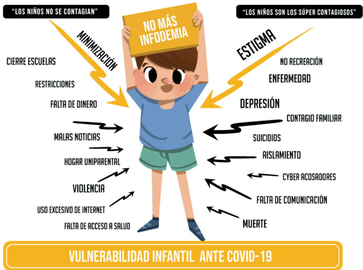
FIGURA 2. Vulnerabilidad Infantil ante COVID-19