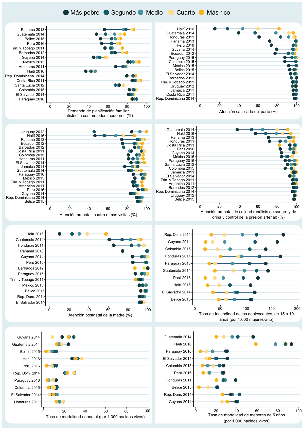
FIGURA 1. Equiplots que muestran la cobertura de los indicadores por quintil de riqueza para los países sobre los cuales hay datos