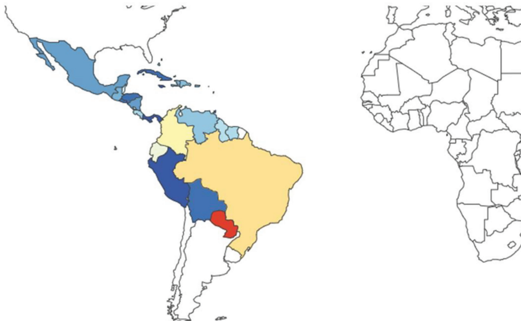
FIGURA 1. Países das sub-regiões da América Latina e Caribe de acordo com o estudo GBD 2019

a DALY: disability-adjusted life years, anos de vida perdidos por morte ou incapacidade; GBD: Global Burden of Disease.