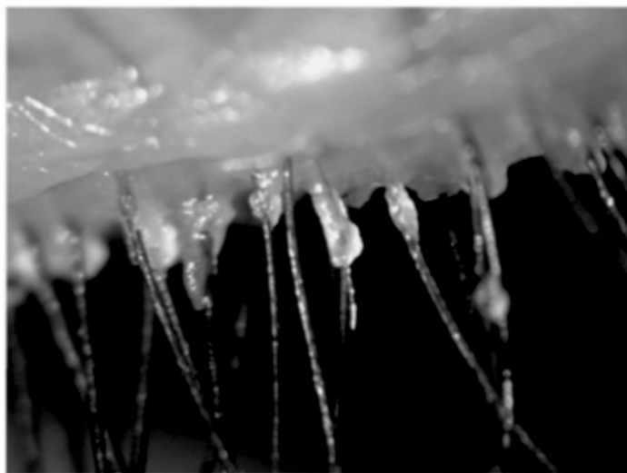
Figura 2. Descamación en forma de cilindros en un caso de blefaritis con presencia de D. folliculorum

La prevalencia total de infección por Demodex fue del 42,1 % (n=54). El parásito se encontró en 8 de los 41 pacientes menores de 30 años (19,5 %), en 17 de los 35 (48,5 %) del grupo comprendido entre los 31-50 años,