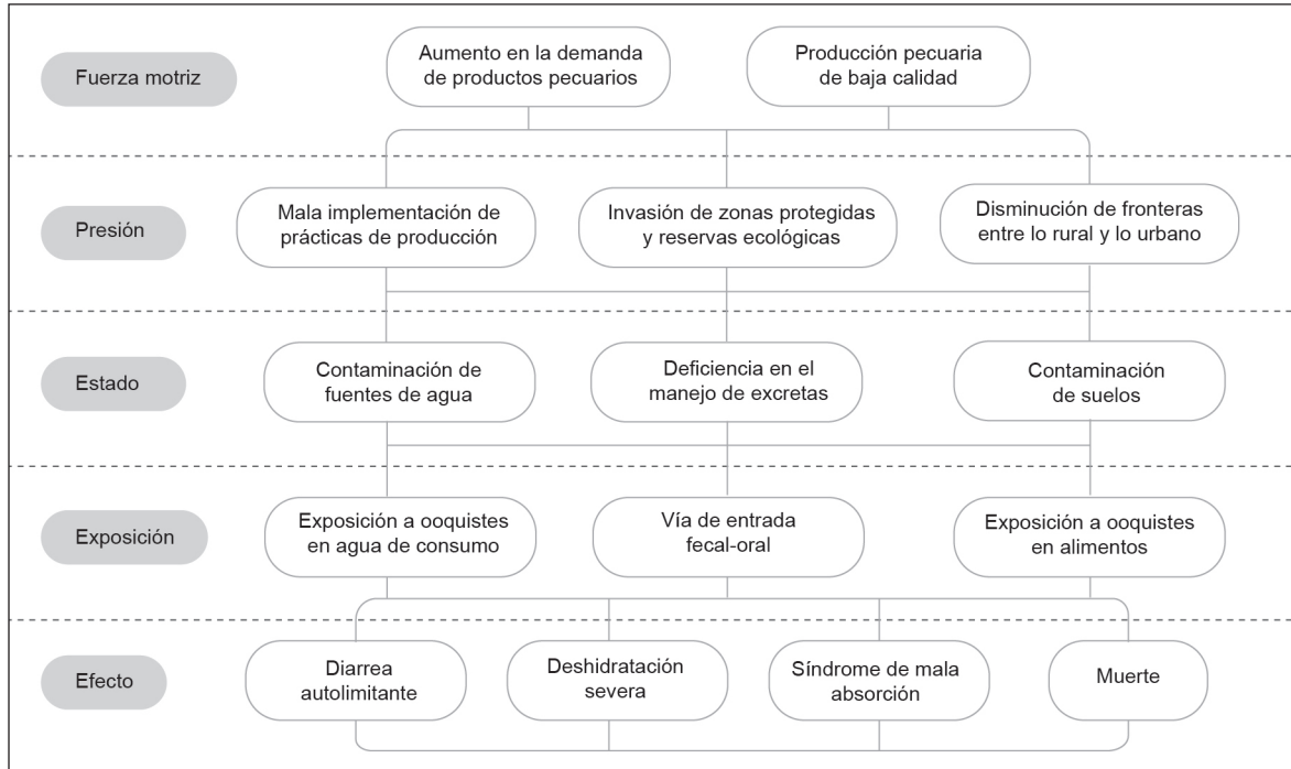
Figura 1. Matriz analítica de las fuerzas motrices en el caso de la exposición a ooquistes de Cryptosporidium para humanos y animales en Colombia. Autores 2019

te del sacrificio de bovinos fueron en primer lugar Bogotá con 141 989 cabezas (16,2%); seguido de Antioquia con 140 321 cabezas (16,1%); en tercer lugar, Santander donde se sacrificaron 710 cabezas (8,2%) (10).