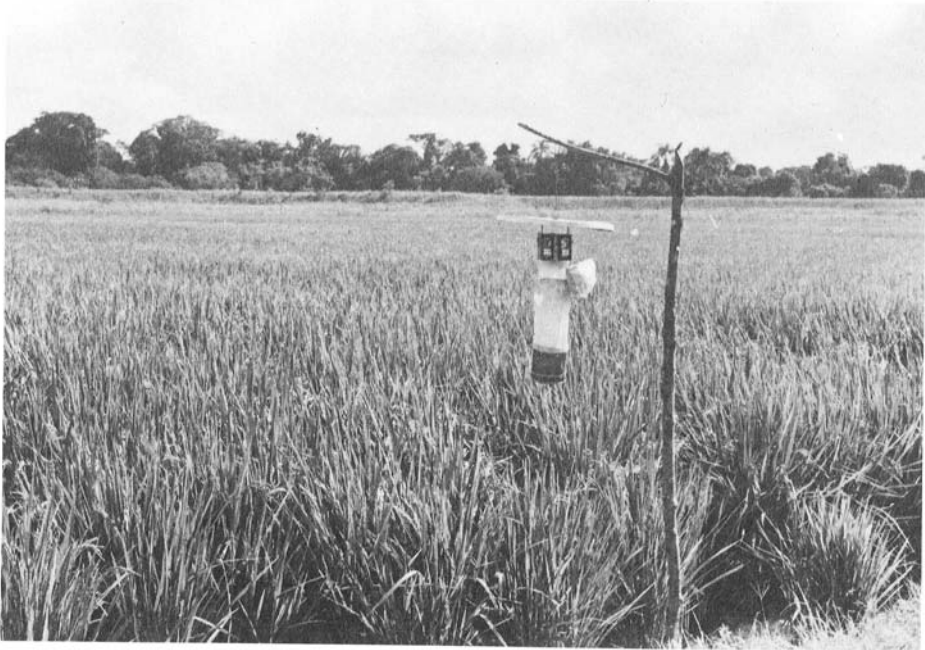
Fig. 1 — Armadilha miniatura CDC com isca de gelo-seco (CO 2 ), que operou no polder da Estação Experimental de Pariquera-Açú (EEPA).

Coletas — Procedeu-se à coleta de formas adultas de culicídeos mediante o emprego de duas armadilhas tipo CDC miniatura, iscadas com gelo-seco (Fig. 1). Instaladas no polder e separadas por distância de 200 m, esses dispositivos operaram mensalmente, sempre no horário das 17:00 às 21:00 hs.