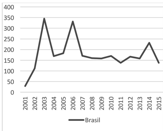
Gráficos 1 e 2 – Série histórica de implantação dos Centros de Atenção Psicossocial no Brasil e por localização (capitais e porte populacional para os municípios do interior)

Os Gráficos 1 e 2 indicam que o primeiro salto na linha de crescimento dos CAPS no Brasil se deu pelo grande número de serviços implantados nas capitais e nos municípios de menor porte (médio, médio pequeno e pequeno) logo após a Lei nº 10.216/2001. Os saltos seguintes foram resultados do significativo número de serviços implantados nos municípios de pequeno porte, o que indica forte processo de interiorização dos CAPS no país, especialmente nas localidades com população inferior a 50 mil habitantes.