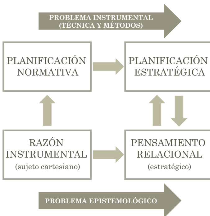
Figura 1. Las limitaciones de la planificación: ¿problema instrumental o epistemológico?

No es casual que los programas predominen en territorios marcados por las desigualdades: el proyecto político-económico e ideológico-cultural que representan es