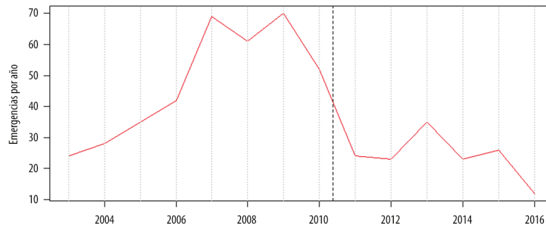
Figura 2. Número de urgencias atendidas por año en el Instituto Psiquiátrico Municipal. Río de Janeiro, Brasil, 2003-2016.