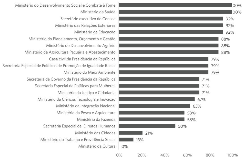
Gráfico 1. Participação dos representantes governamentais na Caisan de 2012 a 2016

função de secretário-geral. Todas foram dirigidas pelos secretários executivos da Câmara. O gráfico 1 ilustra a participação dos órgãos governamentais nas plenárias no período.